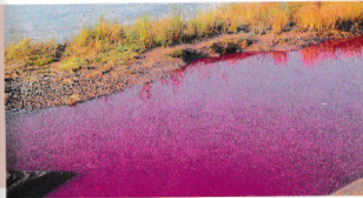
M3 Pink ist diese Saison „in“, in China erkennt das jedes Kind an der Farbe des Flusses.