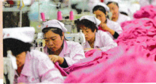
M4 Näherinnen in einer chinesischen Textilfabrik